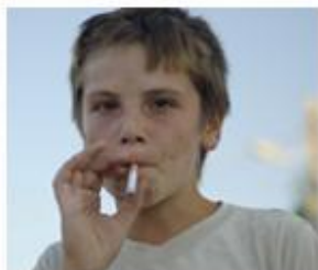
Bambini che fumano

? Quali sono i rischi del fumo per un bambino?