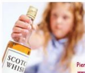
Bambini che bevono

Pierluigi De Pascalis www.depascalis.net