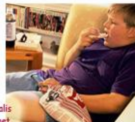
Bambini che mangiano

? Quali sono i rischi dell'obesità per un bambino?